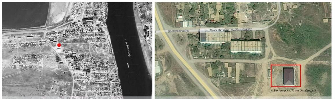
Место размещения благоустраиваемой территории в структуре населенного пункта